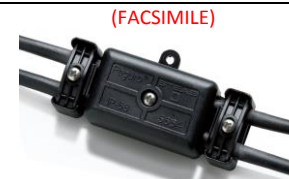
Connettore IP 68 tipo o similare Steab Paguro 5664

ATTENZIONE: Prima di iniziare i collegamenti elettrici assicurarsi che l'alimentatore non sia in tensione. Il mancato rispetto di questa semplice regola compromette irrimediabilmente la sorgente luminosa.