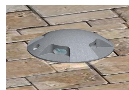
Cassa a filo pavimento su fondo drenante. Fori di fissaggio corpo perpendicolari all'emissione luce