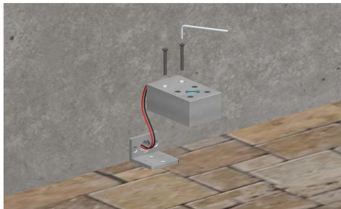
Eeguire connessione elettrica prestando attenzione alla polarità dei cavi e fissare corpo con le viti in dotazione